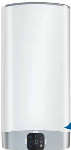
DUO5 80 LITROS